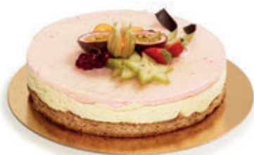
MOUSSEKAKE MED BRINGEBÆR OG PASJONSFRUKT