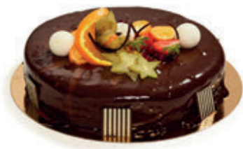
MOUSSEKAKE MED MØRK & LYS SJOKOLADE