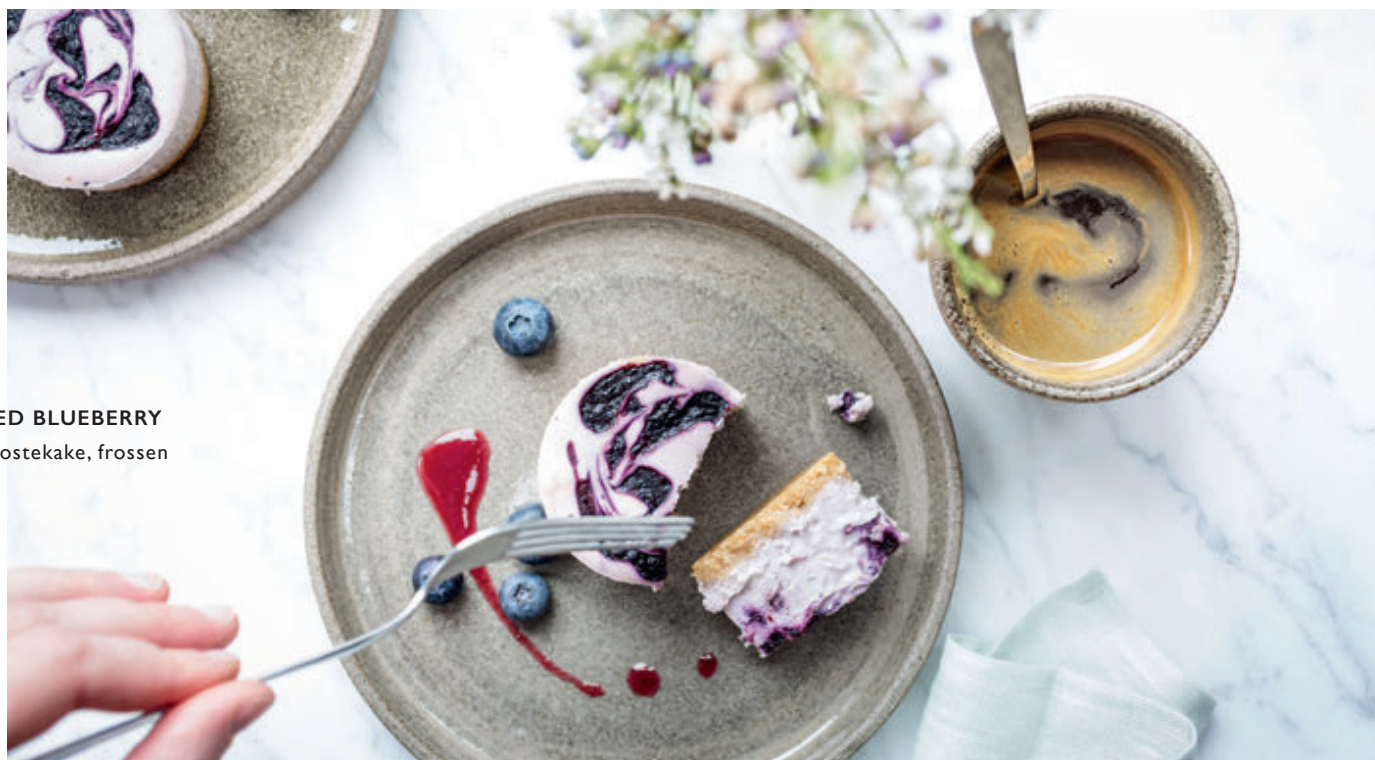
MARbled BLUEBERRY Porsjonsostekake, frossen S 41