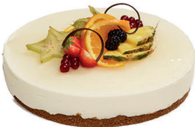
OSTEKAKE MED FRISKE FRUKTER