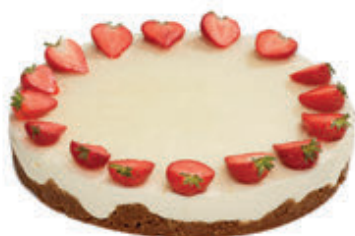
OSTEKAKEDISK MED JORDBÆR